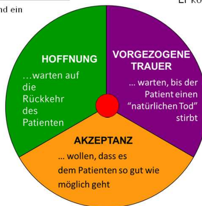
Abbildung 2: Haltungs-Typen von Angehörigen, die sich aus der Erwartung einer Besserung, Stagnation oder Verschlechterung des Zustands des Patienten ergeben