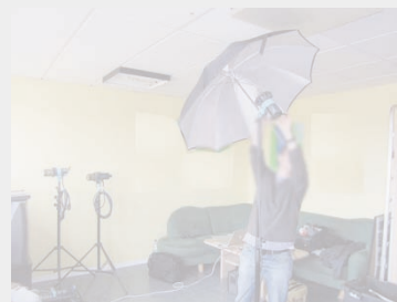
Abb. 2: Aufbau Fotoshooting (F fotografiert P, 2010)

Der Methode einer (audio-) visuellen Ethnografie folgend (vgl. Schändlinger 1998, 2006) werden im Rahmen der Feldforschung Bilderstellungsprozesse digitaler fotografischer Portraits mit Hilfe von Fotoapparat und Videokamera aufgezeichnet.