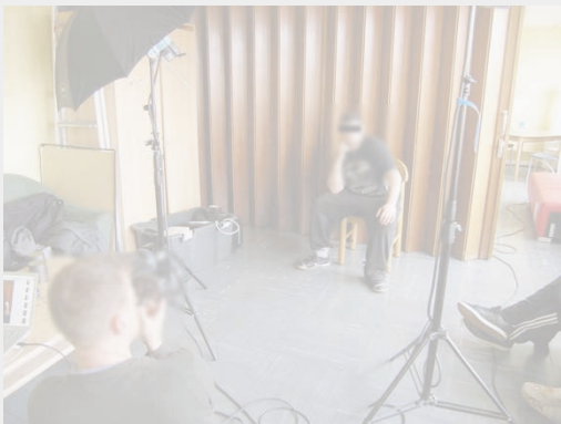
Abb. 1: Fotoshooting (F fotografiert P, 2010)

In temporären fotografischen Räumen (Settings) wird Portraitbildlichkeit durch soziales Handeln unter Verwendung fotografischer Techniken in einem interaktiven Ordnungs- und Sinnbildungsprozess hergestellt (kulturelle Praxis).