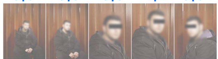
Abb. 4: Schaubild Bildproduktionspraxis Portrait (Fotoshooting F fotografiert P, 2010) © Thomas Abel 2010