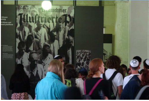
KZ-Gedenkstätte Dachau, Ausstellung